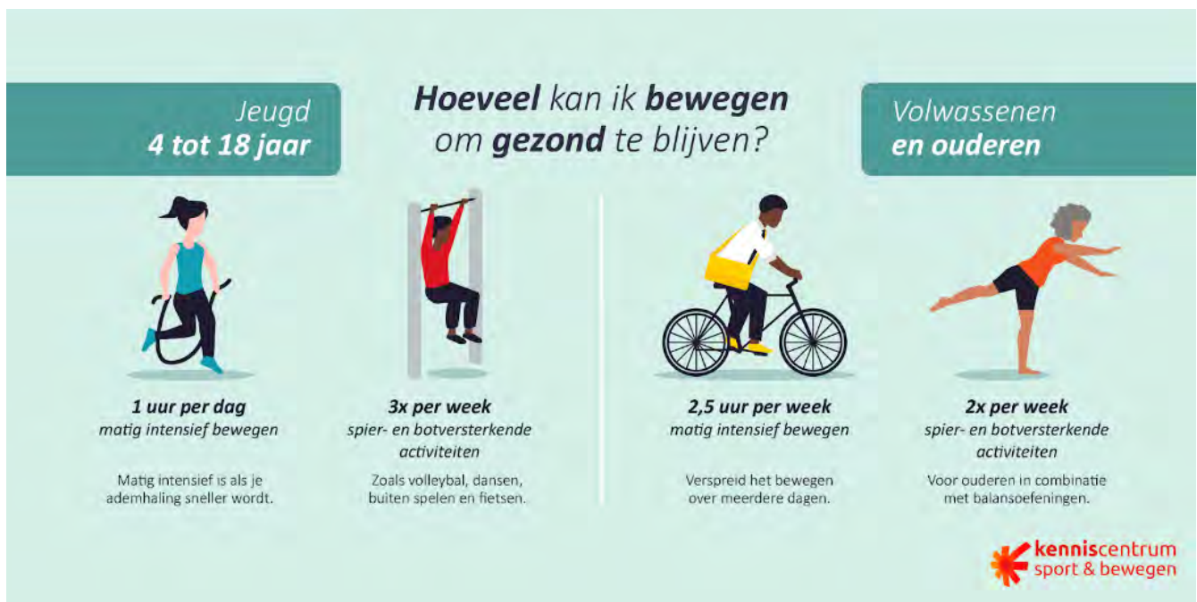
Figuur 1 De beweegrichtlijnen (Kenniscentrum Sport & Bewegen)

Volgens deze richtlijnen bewoog in 2022 nog niet de helft van de Nederlanders van vier jaar en ouder voldoende. Daarnaast brengen Nederlanders van 4 jaar en ouder dagelijks gemiddeld 9 uur zittend door 2 . Onderzoek van het RIVM 3 laat bovendien zien dat, bij gelijkblijvend beleid, Nederlanders in de toekomst niet meer zullen bewegen dan nu. Bovendien zijn er tussen groepen in de samenleving grote verschillen te zien in beweeggedrag.