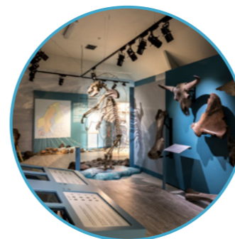
MUSEUM SCHOKLAND Nummer 1

Centraal gelegen op dit eerste Nederlandse werelderfgoed vind je museum Schokland. De historische kerk uit 1834 en de opvallende houten museumgebouwen vormen een markant punt in het moderne landschap van de Noordoostpolder.