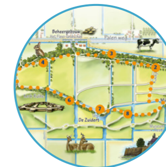
LUISTERROUTES Nummer 3

In het bezoekerscentrum kun je een tentoonstelling bekijken over het ontstaan van de aarde en van stenen. En natuurlijk is er ook informatie te vinden over de geschiedenis en de natuur van Schokland.