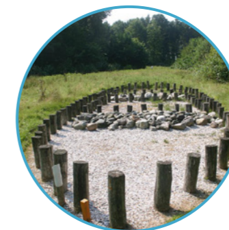
GESTEENTETUIN Nummer 2

De presentatie neemt de bezoeker letterlijk mee door de bijzondere geschiedenis, vanaf de ijstijd tot nu, en daagt je uit met diverse interactieve presentaties. Deze opstelling is ook geschikt voor gezinnen met kinderen.