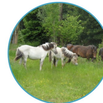
PAARDENVALLEI Nummer 3

De route loopt parallel aan de wandel en fietsroutes van het Zuigerplasbos. Bijzonder aan dit stukje route is dat die speciaal ontworpen is als kindermountainbikeroute, zodat ook de jongste mountainbikers hier terecht kunnen. De route loopt ook door het Belevenissenbos.